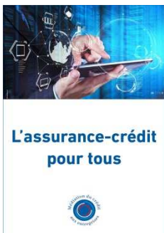
Table-ronde animée par Fabrice PESIN